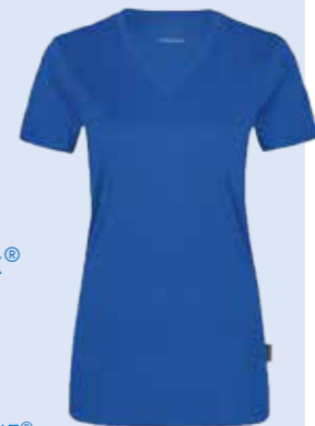
Hakro Women-V-Shirt Coolmax® Artikel: 187

Funktionelles, sportlich leger geschnittenes T-Shirt.