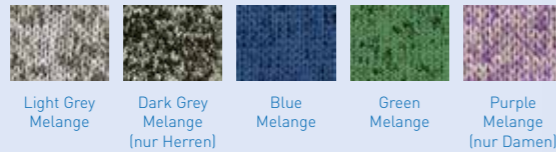
Active Knit Fleece Jacket Artikel: 832.05