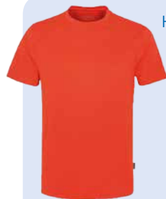
Hakro Herren T-Shirt Coolmax® Artikel: 287

inkl. Stick bis. max 15 cm 2 auf einer Position Richtpreis für 50 Stück € 24,95 / Stück zzgl. € 80,- Nebenkosten