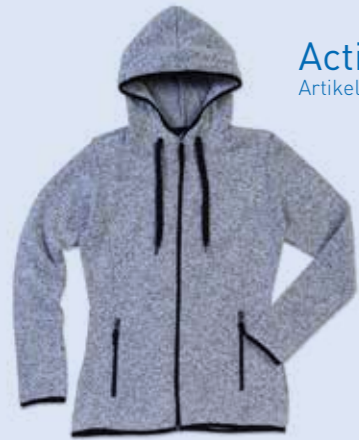
Active Knit Fleece Jacket Women Artikel: 833.05